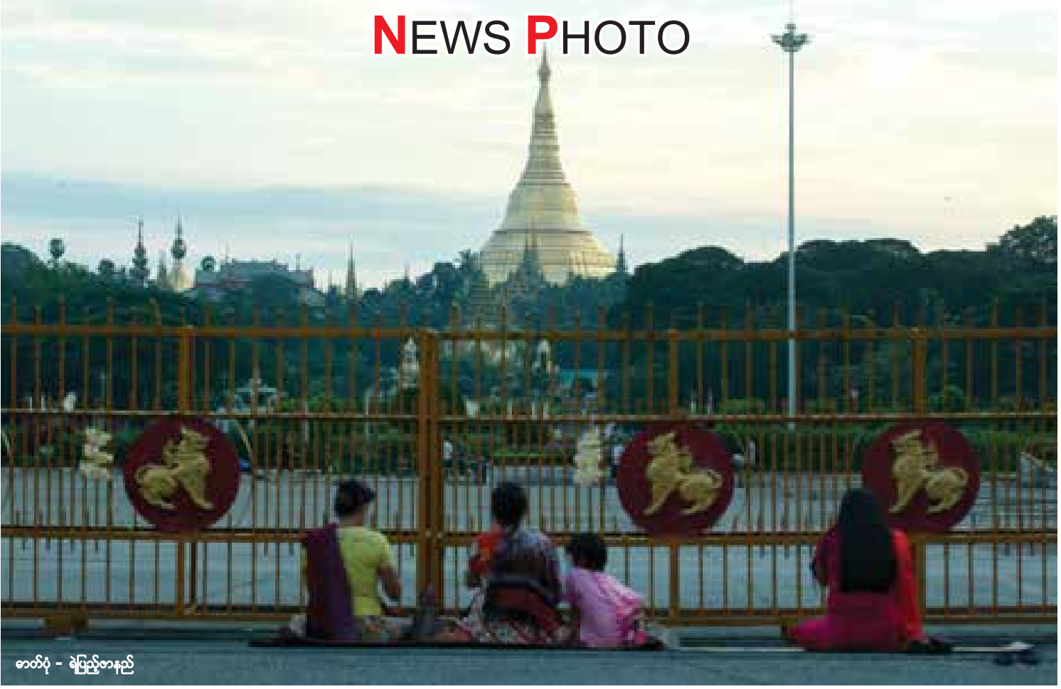
ဓာတ်ပုံ - ခဲပြည့်စာနည် အတိအမှအမီတော်နေ့ (သီတင်းကျွတ်လပြည့်နေ့) တွင် ရွှေတိဂုံဓမ္မတော်မြတ်ကြီးကို ဖူးမြော်ခွင့်ပိတ်ပင်ထားသော်လည်း ပြည်လမ်းမပေါ်ရှိ ပြည်သူရင်ပြင်ရှေ့တွင် ဓမ္မတော်မြတ်ကြီးအား လာရောက်ဖူးမြော်ကြသူများကို အောက်တိုဘာလ ၃၁ ရက်နေ့က တွေ့မြင်ရစဉ်