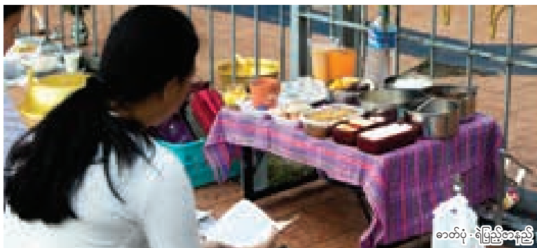
★ ရွှေတိဂုံစေတီတော်ကိုလာရောက်ဖူးမြော်သူတစ်ဦး