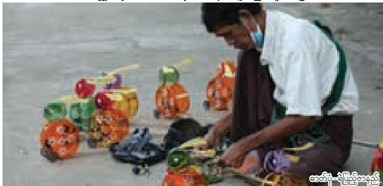
★ သီတင်းကျွတ်မီးပုံးပြုလုပ်ရောင်းချနေသူတစ်ဦး