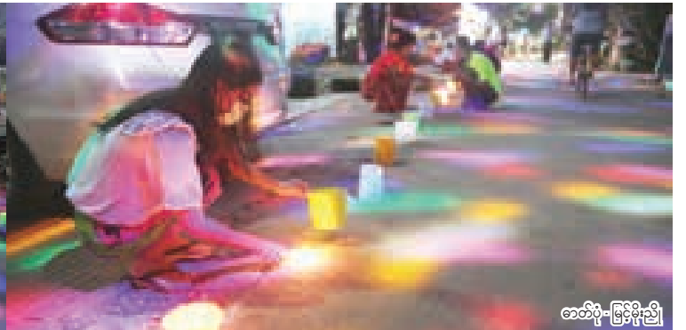
★ ရန်ကုန်မြို့၊ သုဝဏ္ဏ ရန်ကုန်သစ်ရပ်ကွက် ဘုရင့်နောင်ကမ်းနားလမ်းတွင် ဆီမီး ၉၀၀ ထွန်းညှိထားစဉ်