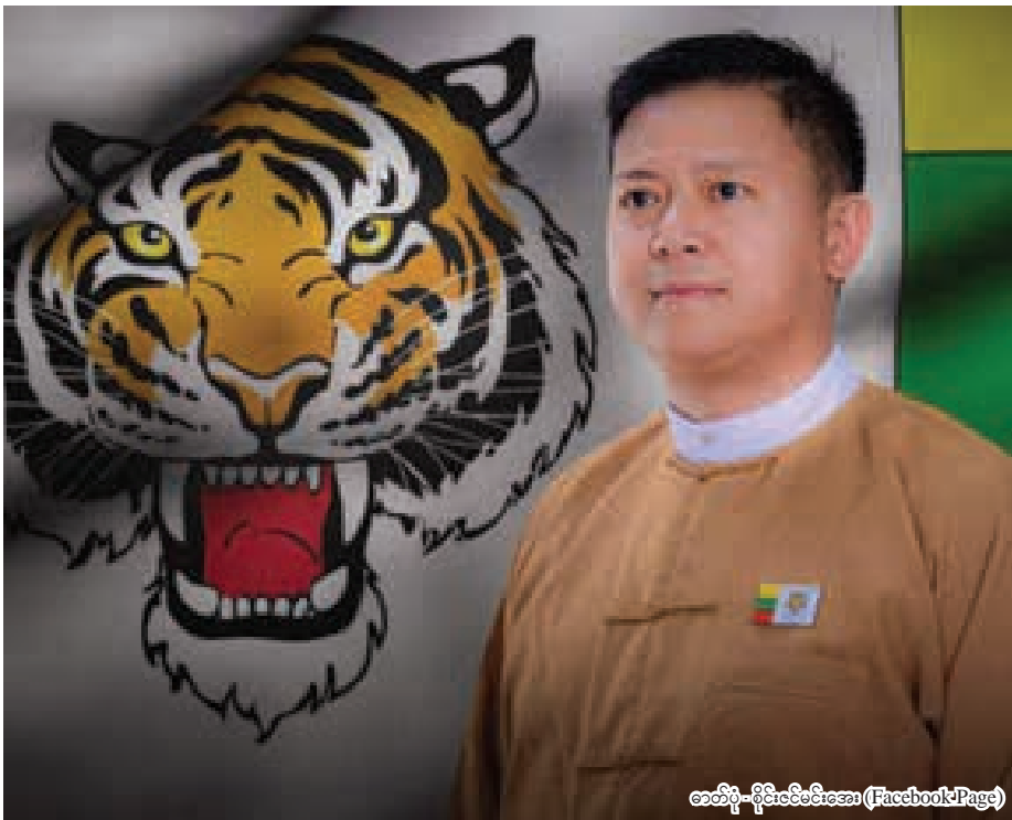
စာတိုပုံ-ရိုမီဇီမေးအေး (Facebook Page)

SZMA : ကျွန်တော့်အမြင်ကတော့ တန်းတူရေး၊ ကိုယ်ပိုင်ပြဋ္ဌာန်းခွင့်အတွက် တော်လှန်ခဲ့ကြတယ်။ တော်လှန်ရေး ရှည်ကြာလာတာနဲ့အမျှ ဒီဖြစ်စဉ်အပေါ်မှာ အခွင့်ကောင်းယူချင်တဲ့သူတွေများလာတော့ ငြိမ်းချမ်းရေးက ဝေးနေတယ်လို့မြင်ပါတယ်။ နောက်ကွယ်က အကျိုးစီးပွားတွေကို ဘက်ပေါင်းစုံကနေ