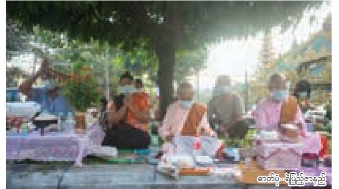
★ ရွှေတိဂုံစေတီတော် အရှောက်မုခ်တစ်နေရာ