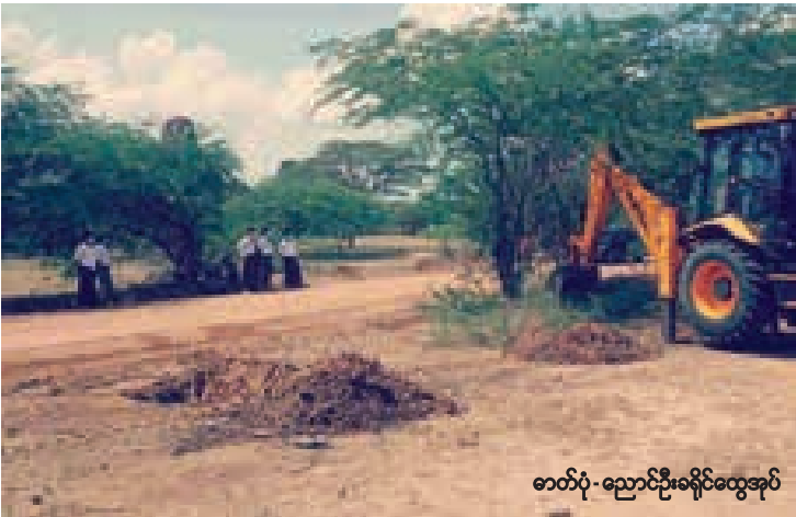
ဓာတ်ပုံ-ညောင်ဦးခရိုင်ထွေအုပ်

ပုဂံဒေသသည် မြန်မာမျိုးသားရေးလက္ခဏာတစ်ရပ်အနေဖြင့်လည်းကောင်း၊ များပြားလှသည့် ရှေးဟောင်းလက်ရာစေတီပုထိုးများကြောင့်လည်းကောင်း ကမ္ဘာလှည့်ခရီးသည်များကို ဆွဲဆောင်ရာနေရာအဖြစ် ကမ္ဘာကျော်သည့်နေရာတစ်ခု ဖြစ်သည်။