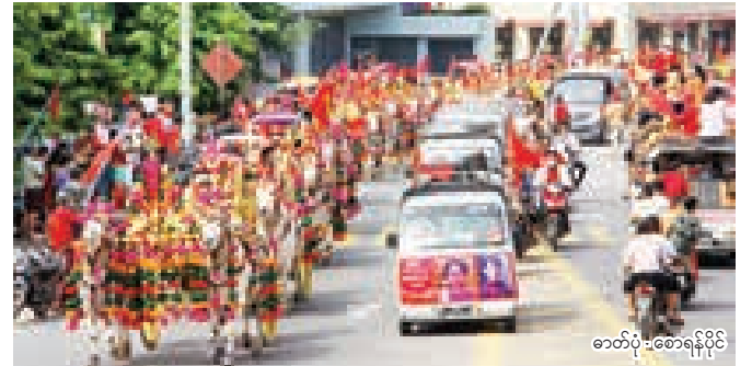
★ စစ်ကိုင်းမြို့တွင် သီတင်းကျွတ်လပြည့်နေ့က NLD ထောက်ခံဝန်းရံသူများကိုတွေ့ရစဉ်