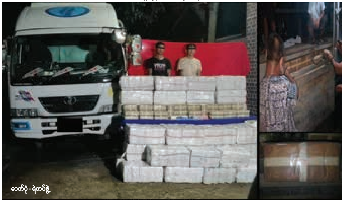
တင်ဆက်သည့် စိုင်းရွှေ နှင့် တင်ဆက်သည့်ပစ္စည်းများ

ရန်ကုန်မြောက်ပိုင်းခရိုင်၊ မင်္ဂလာဒုံ မြို့နယ်၊ အမှတ်(၃)လမ်းတွင် ကုန်တင် ယာဉ်တစ်စီးကို စစ်ဆေးရာမှ မူးယစ် ဂိုဏ်းအဖွဲ့ဝင် တရားခံပြေးနှစ်ဦးကိုကျပ် ၅ ဘီလီယံကျော်တန်ဖိုးရှိ စိတ်ကြွ ဆေးပြားများနှင့်အတူ ဖမ်းမိခဲ့သည်။