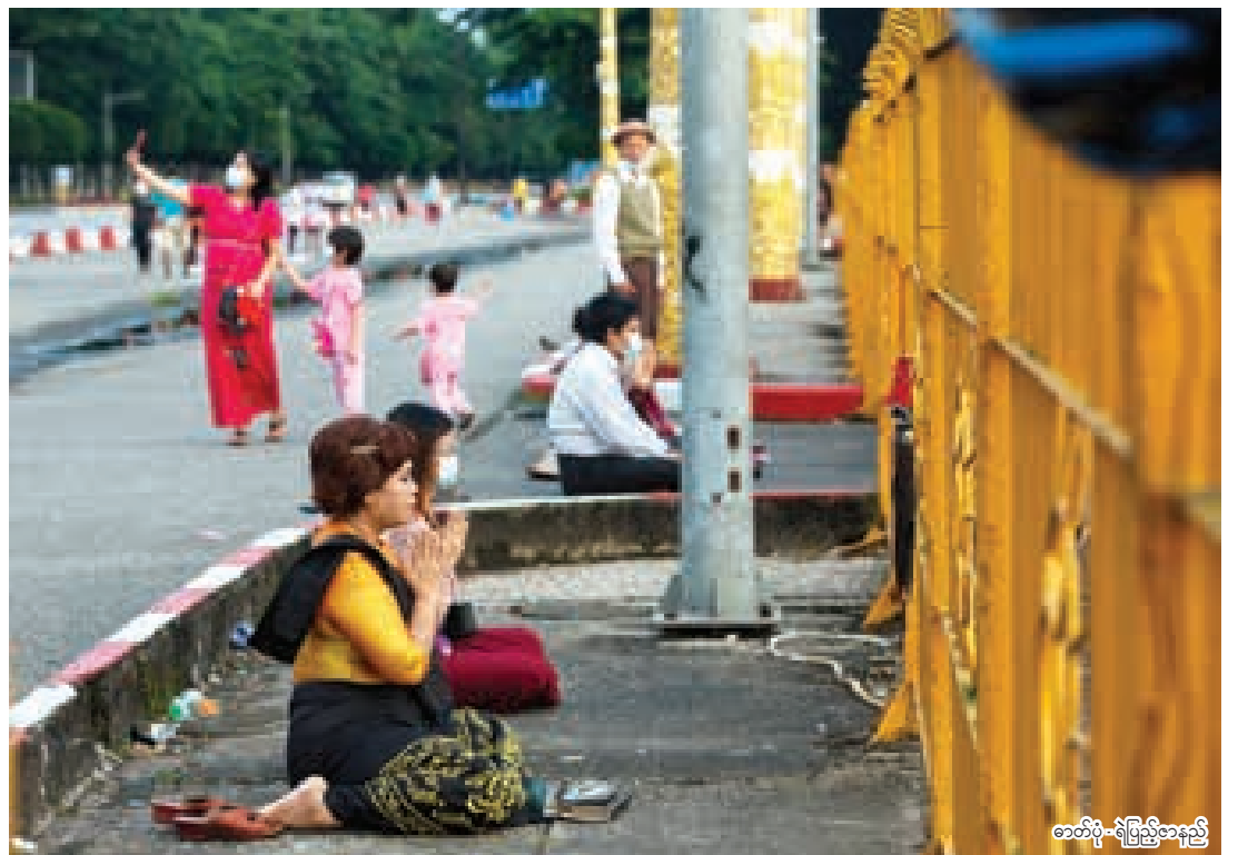
★ ရန်ကုန်မြို့ပြည်သူ့ရင်ပြင်ရှေ့တွင် ရွှေတိဂုံစေတီတော်ကို ဖူးမြော်နေသူအချို့