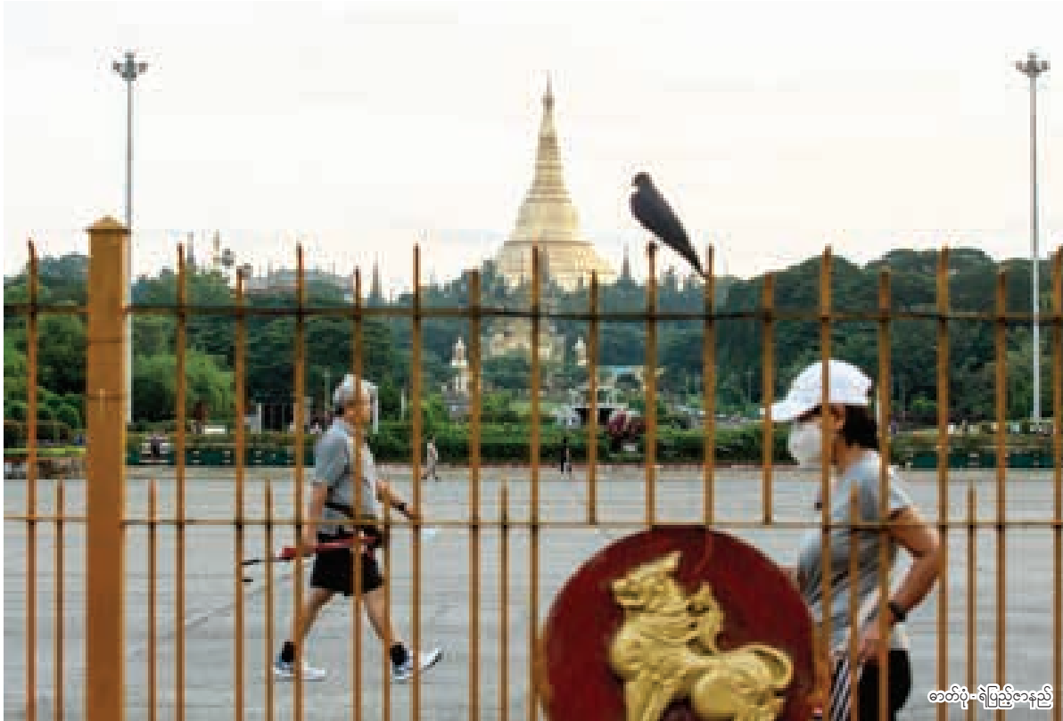
★ လေးဆူဓာတ်ပုံရွှေတိဂုံစေတီတော်ကို သီတင်းကျွတ်လပြည့်နေ့က ပြည်သူ့ရင်ပြင်ရှေ့မှ ဖူးမြော်ရစဉ်

သီတင်းကျွတ်လပြည့်နေ့သည် ဗုဒ္ဓဘာသာဝင်တို့၏ နေ့ထူးနေ့မြတ်ဖြစ်သည့် အဘိဓမ္မာအခါတော်နေ့ဖြစ်သည်။ နှစ်စဉ်သီတင်းကျွတ်လပြည့်နေ့တိုင်းတွင် ဘုရားကျောင်းကန်များတွင် လာရောက်ဖူးမြော်ကြသူများ၊ စတုဒိသာကျွေးမွေးသူများဖြင့် နှစ်စဉ်စည်ကားခဲ့သည်။ ယခုနှစ် Covid ကပ်ဘေးကာလအတွင်း ကျရောက်သည့် အဘိဓမ္မာအခါတော်နေ့မြင်ကွင်းအချို့ကို ဖော်ပြလိုက်ပါသည်။