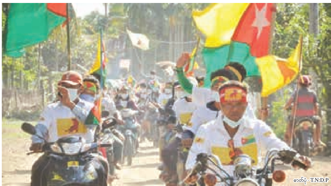
တိုင်းလိုင် (ရှမ်းနီ) အမျိုးသားများ ဖွံ့ဖြိုးတိုးတက်ရေးပါတီ ခိုးကောင်းမြို့တွင် အင်အားပြလှည့်လည်နေစဉ်