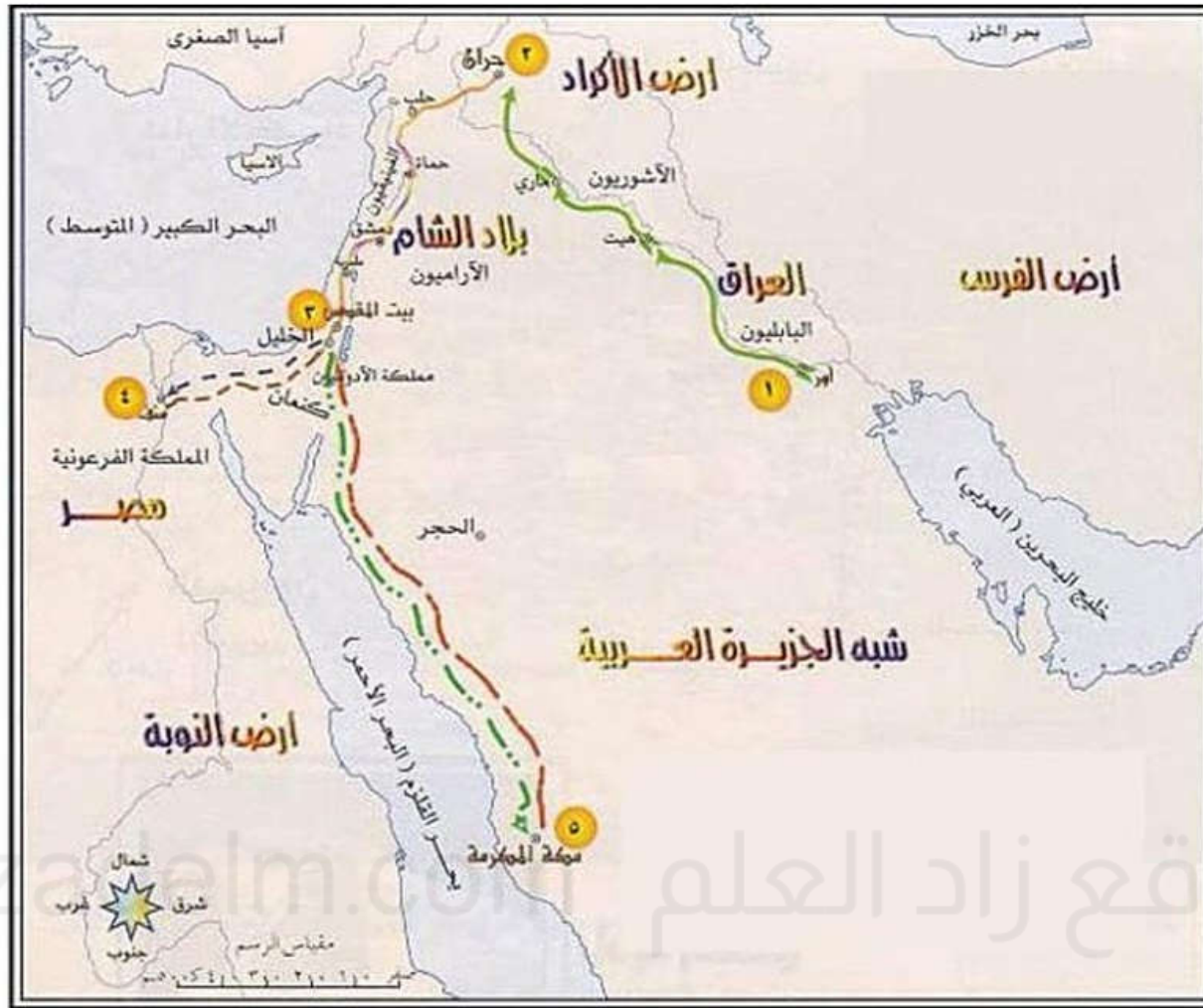
هجرة إبراهيم عليه السلام