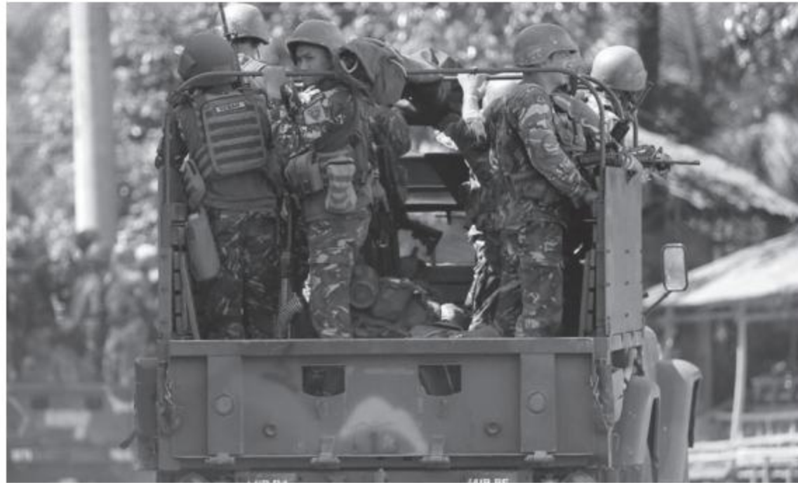
Government soldiers are seen on a military truck as they continue their assault on insurgents from the Maute group, who have taken over large parts of Marawi City, Philippines, on June 1, 2017.

"The bomb fell in an area proximate to a building where some of our men were staying and the ensuing blast caused part of that