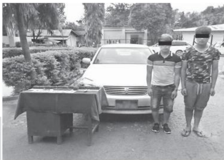
မူးယစ်ဆေးဝါးများနှင့်အတူ ဖမ်းဆီးရမိသူများ ကိုတွေ့ရစဉ်။

နေပြည်တော် ၈ လိုင်း ၁၃ ရှမ်းပြည်နယ်(မြောက်ပိုင်း)၊ မူဆယ်မြို့ နယ်နိမိတ်တောင်ဘက် ၁၂ မိုင်ခန့်အကွာရှိ နန့်အွန်ကျေးရွာအုပ်စု နန့်ပေါ်တံတားအနီး ၌ တပ်မတော်သားများ၊ မြန်မာနိုင်ငံရဲတပ်ဖွဲ့ ဝင်များနှင့် ဌာနဆိုင်ရာတာဝန်ရှိသူများပါဝင် သော ပူးပေါင်းအဖွဲ့က မော်တော်ယာဉ်များ အား ရှောင်တခင်စစ်ဆေးခြင်းဆောင်ရွက် စဉ် ယနေ့ မွန်းလွဲ ၁ နာရီခွဲခန့်တွင် ကွတ်ခိုင် ဘက်မှ မူဆယ်ဘက်သို့ မောင်းနှင်လာသည့်