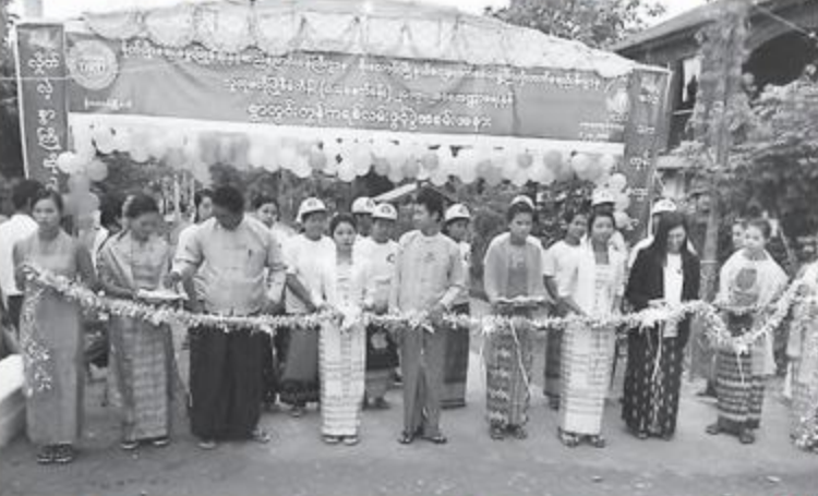
အဆိုပါကျေးရွာလမ်းမှာ အရှည်ပေ ၆၅၀၊ အကျယ် ၂ ပေ၊ ထု ၆ လက်မရှိ ကွန်ကရစ်လမ်းသစ်ဖြစ်ပြီး လူထုပတ်သက်မှု

ထို့နောက် မြို့နယ်ကျေးလက်ဒေသဖွံ့ဖြိုး တိုးတက်ရေးဦးစီးဌာန ဦးစီးမှူးနှင့်တက် ရောက်လာကြသူများက လမ်းသစ်ကို ဖြတ် သန်းကြည့်ကြသည်။