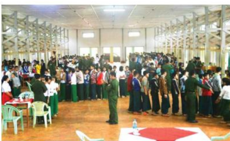
အရှေ့ပိုင်းတိုင်းစစ်ဌာနချုပ် နယ်လှည့်ဆေးကုသရေးအဖွဲ့က ကျောင်းသား၊ ကျောင်းသူများအား ကျန်းမာရေးစောင့်ရှောက်မှုလုပ်ငန်းများဆောင်ရွက်ပေးစဉ်။

နေပြည်တော် ၇ ဇူလိုင် ၁၃ ရှမ်းပြည်နယ်(မြောက်ပိုင်း) ကြို့ကုတ် (ပန်ဆိုင်)မြို့နယ်အတွင်းရှိ မော်တောင်း ကျေးရွာ၏အနောက်ဘက် မီတာ ၂၅၀၀ ခန့် အကွာ မော်တောင်း-၁၀၅ မိုင်သွားကားလမ်း အနီး၌ အကြမ်းဖက်သောင်းကျန်းသူများထောင် ထားသည့် ဒေသန္တရလုပ်လုပ်မိုင်းတစ်လုံး တွေ့ရှိရကြောင်း ယနေ့ညနေ ၃ နာရီခန့်တွင် ဒေသခံတိုင်းရင်းသားပြည်သူတစ်ဦး၏ သတင်း ပို့ချက်အရ နယ်မြေခံတပ်မှ တပ်မတော်သား များက သွားရောက်ရှင်းလင်းရာ အဆိုပါနေရာ တွင် ဒေသန္တရလုပ်အဝေးထိန်းစနစ်မိုင်းတစ် လုံးအား တွေ့ရှိရသဖြင့် နယ်မြေခံတပ်မှ အထူးမိုင်းရှင်းလင်းရေးတပ်ဖွဲ့များဖြင့် သက်မဲ့ ပြုလုပ်ရှင်းလင်းခဲ့ပြီး အဆိုပါနေရာတစ်ဝိုက် အား နယ်မြေရှင်းလင်းရေးလုပ်ငန်းများ ဆောင်ရွက်လျက်ရှိကြောင်း သတင်းရရှိ သည်။ (၁၀၀)