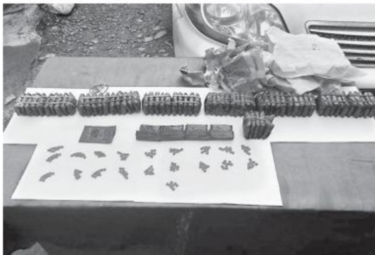
ထိမ်းဆည်းရမိ မူးယစ်ဆေးဝါးများကိုတွေ့ရစဉ်။

ကျိန်ကွင်းချိန်(ဘ) ဦးကျိန်ကွေးယုံ မောင်းနှင် ပြီး ဝမ်းရွှံ့ဝေ(ဘ) ဦးဝမ်းချန်ကျီးလိုက်ပါ လာသည့် မော်တော်အမျိုးအစား ယာဉ်အမှတ်၊ 7H/---- အား စစ်ဆေးရာ ယာဉ်နောက်ခန်း ထိုင်ခုံကြားအံ့ဝှက်အတွင်းမှ တိပ်အကြည် မြင့်ပတ်ထားသည့် အထုပ်သုံးထုပ်အတွင်းမှ 88/1 ဓာတုန်းပါ ပန်းရောင်စိတ်ကြွရွှေးသွပ် ဆေးပြား ၁၇၈၆၀ ပြား(ခန့်မှန်းတန်ဖိုးငွေကျပ် ၂၀၇ သိန်းကျော်)နှင့်အတူ ဖမ်းဆီးရမိခဲ့ သည်။