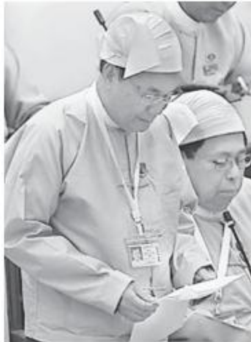
သယံဇာတနှင့် သဘာဝပတ်ဝန်းကျင်ထိန်းသိမ်းရေးဝန်ကြီးဌာန ပြည်ထောင်စုဝန်ကြီး ဦးအုန်းဝင်း။

တိုင်းဒေသကြီး/ပြည်နယ်အလိုက် တရားမဝင်သစ်ဖမ်းဆီးရေးကို တပ်မတော်၊ မြန်မာနိုင်ငံရဲတပ်ဖွဲ့အပါအဝင် သက်ဆိုင်ရာဆက်စပ်ဌာနအဖွဲ့အစည်းများဖြင့် ပူးပေါင်းဖမ်းဆီးခြင်းကိုဆောင်ရွက်လျက်ရှိရာ ၂၀၁၅-၂၀၁၆ ဘဏ္ဍာနှစ်အတွင်း ရှမ်းပြည်နယ် ဦးလမ်းဒေသ