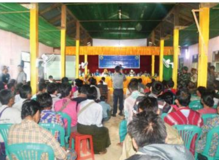
ပဲခူးတိုင်းဒေသကြီး ပစ်ခတ်တိုက်ခိုက်မှုရပ်စဲရေးဆိုင်ရာ ပူးတွဲစောင့်ကြည့်ရေးကော်မတီ (JMC-S)အဖွဲ့ဝင်များနှင့် ဒေသခံတိုင်းရင်းသားပြည်သူများတွေ့ဆုံပွဲကျင်းပစဉ်။