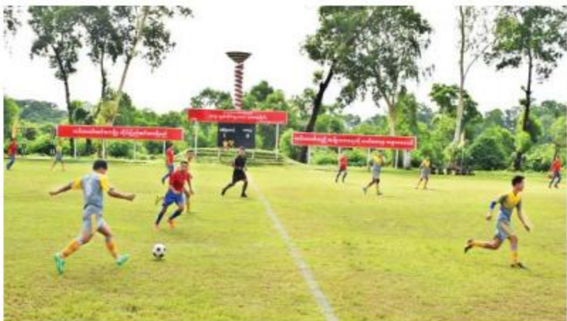
အနောက်တောင်တိုင်းစစ်ဌာနချုပ်၏ ၂၀၁၇ ခုနှစ်၊ တိုင်းမှူးပလားဘောလုံးပြိုင်ပွဲ ပထမနေ့ ပွဲစဉ်ယှဉ်ပြိုင်ကစားစဉ်။

နေပြည်တော် ၇ ဇူလိုင် ၁၃ အနောက်တောင်တိုင်းစစ်ဌာနချုပ်၏ ၂၀၁၇ ခုနှစ်၊ တိုင်းမှူးပလားဘောလုံးပြိုင်ပွဲ ဖွင့်ပွဲကို ယနေ့နံနက်ပိုင်းတွင် ပုသိမ်တပ်နယ် ဘောလုံးကွင်း၌ပြုလုပ်ရာ တိုင်းမှူး ဗိုလ်ချုပ် တေဇကျော်နှင့် အရာရှိ၊ စစ်သည်၊ မိသားစု များ၊ ဒိုင်အဖွဲ့ဝင်များ၊ ပြိုင်ပွဲဝင်အသင်းများ နှင့် အားကစားဝါသနာရှင်များ တက်ရောက် ကြသည်။ ဖွင့်ပွဲတွင် တိုင်းမှူးကအမှာစကားပြောကြား ပြီး တက်ရောက်လာသူများနှင့် အတူ ပထမနေ့ပွဲစဉ်ဖြစ်သည့် စစ်မြေပြင်ဆေးတပ် ရင်းအသင်းနှင့် အနောက်တောင်တိုင်းစစ်ဌာန ချုပ်(စခန်းရုံး)အသင်းတို့၏ ယှဉ်ပြိုင်ကစား မှုများကို ကြည့်ရှုအားပေးကြသည်။ အဆိုပါဘောလုံးပြိုင်ပွဲကို တိုင်းစစ်ဌာန ချုပ်ကွပ်ကဲမှုအောက် တပ်ရင်း/တပ်ဖွဲ့များမှ