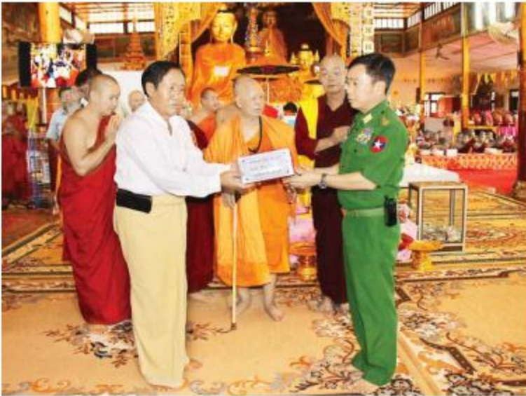
ဓမ္မောဒယပရိယတ္တိစာသင်တိုက် ဦးစီးပဓာနနာယကဆရာတော်၏ အန္တိမဈာပန သာဓုကိဋ္ဌနပူဇာသဘင်ကျင်းပရန်အတွက် တပ်မတော်(ကြည်း၊ ခေမ္မာ) မိသားစုများကလှူဒါန်းသည့် ငွေကျပ်သိန်း ၅၀ ကို ကာကွယ်ရေးဦးစီးချုပ်မှူး(ကြည်း)မှ ခုတိယဗိုလ်ချုပ်ကြီးသန်းထွန်းဦးက ပေးအပ်စဉ်။

အလှူငွေပေးအပ်ပွဲသို့ တာချီလိတ်မြို့၊ နဂါးနှစ်ကောင်ကျောင်းတိုက်ဆရာတော် နိုင်ငံတော်ဩဝါဒါစရိယ အဘိဇေ အဂ္ဂမဟာသဒ္ဓမ္မဇောတိက အဂ္ဂမဟာပဏ္ဍိတ ဂုဏ်ထူးဆောင် ပါရဂူဘွဲ့ရ ဘဒ္ဒန္တဓမ္မသီရိအမှူးပြုသော သံဃာတော်များ ကြွရောက်တော်မူကြပြီး ကာကွယ်ရေးဦးစီးချုပ်မှူး(ကြည်း)မှ ခုတိယဗိုလ်ချုပ်ကြီးသန်းထွန်းဦး၊ ကြိုတင်သတ်မှတ်စစ်ဌာနချုပ် တိုင်းမှူး ဗိုလ်ချုပ်အောင်ဇော်အေးနှင့်အဖွဲ့ဝင်များ၊ ဌာနဆိုင်ရာတာဝန်ရှိသူများ၊ အလှူရှင်များ၊ ဖိတ်ကြားထားသူများနှင့် ဒေသခံပြည်သူများ တက်ရောက်ကြသည်။ ဦးစွာ တက်ရောက်လာကြသူများက သံဃာတော်များထံမှ ငါးပါးသီလခံယူဆောက်တည်ကြသည်။ ထို့နောက် အလှူငွေပေးအပ်ပွဲကို ဆက်လက်ပြုလုပ်ရာ တပ်မတော်(ကြည်း၊ ခေမ္မာ) မိသားစုများက လှူဒါန်းသည့် ငွေကျပ် သိန်း ၅၀ ကို ခုတိယဗိုလ်ချုပ်ကြီးသန်းထွန်းဦးကလည်းကောင်း၊ တိုင်းစစ်ဌာနချုပ်နှင့် တပ်ရင်း/တပ်ဖွဲ့များမှ အရာရှိ၊ စစ်သည်၊ မိသားစုများကလည်းကောင်း အလှူငွေကျပ် ၁၆၂ သိန်းနှင့် အလှူရှင်များက လှူဒါန်းသည့် အလှူငွေကျပ် ၁၈၄ သိန်းကို တိုင်းမှူးနှင့်အလှူရှင်များကလည်းကောင်း အသီးသီး ပေးအပ်လှူဒါန်းခဲ့ကြကြောင်း သတင်းရရှိသည်။ (၁၀၀)