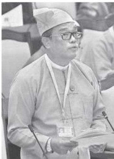
ဆောက်လုပ်ရေးဝန်ကြီးဌာန ဒုတိယဝန်ကြီး ဦးကျော်လင်း။

ကျန်ရှိသော ၄၆ မိုင်လမ်းအပိုင်းကို နိုင်ငံတကာအကူအညီဖြင့် ဆောင်ရွက်မည်မဟုတ်ဘဲ ပြည်နယ်ရန်ပုံငွေဖြင့်သာ ဆက်လက်ဆောင်ရွက်ပေးသွားမည်ဖြစ်ကြောင်းနှင့် ၂၀၂၀-၂၀၂၁ ဘဏ္ဍာနှစ်ကုန်တွင် ရာသီမရွေးသွားလာနိုင်သော အမာခံလမ်းအဖြစ်ရောက်ရှိအောင် အဆင့်မြှင့်တင်ဆောင်ရွက်ပေးသွား