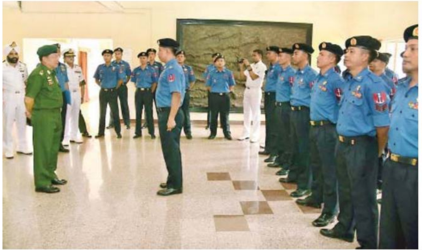
တပ်မတော်ကာကွယ်ရေးဦးစီးချုပ် ဗိုလ်ချုပ်မှူးကြီးမင်းအောင်လှိုင် ဗီဇာခါပတ်တနမ်မြို့ရှိ ရေတပ်လေ့ကျင့်ရေးသင်တန်းကျောင်း၌ တက်ရောက်နေကြသည့် မြန်မာတပ်မတော်(ရေ)မှ အရာရှိ၊ စစ်သည်များအား တွေ့ဆုံအမှာစကားပြောကြားစဉ်။

နေပြည်တော် ၈ ဇူလိုင် ၁၃ အိန္ဒိယနိုင်ငံတွင် ချစ်ကြည်ရေးခရီးရောက်ရှိနေသည့် တပ်မတော် ကာကွယ်ရေးဦးစီးချုပ် ဗိုလ်ချုပ်မှူးကြီးမင်းအောင်လှိုင်ဦးဆောင်သော မြန်မာတပ်မတော်ချစ်ကြည်ရေးကိုယ်စားလှယ်အဖွဲ့သည် ယနေ့ နံနက်ပိုင်းတွင် ဗီဇာခါပတ်တနမ်မြို့ရှိ ရေတပ်လေ့ကျင့်ရေးသင်တန်းကျောင်းသို့ သွားရောက်လေ့လာကြရာ ကျောင်းအုပ်ကြီး Commanding Officer Captain Mukyl Surange နှင့် တာဝန်ရှိသူများက ကြိုဆိုနှုတ်ဆက်ကြသည်။ ဦးစွာ တပ်မတော်ကာကွယ်ရေးဦးစီးချုပ် ဗိုလ်ချုပ်မှူးကြီးမင်းအောင်လှိုင်က သင်တန်းကျောင်း၌တက်ရောက်နေကြသည့် မြန်မာတပ်မတော်(ရေ)မှ အရာရှိ၊ စစ်သည်များအား တွေ့ဆုံအမှာစကားပြောကြားရာတွင် မြန်မာတပ်မတော်အနေဖြင့် တပ်မတော်(ရေ)၏ စွမ်းအားမြှင့်တင်ရန် ခေတ်မီတပ်မတော် ရေတပ်တည်ဆောက်ရန်အတွက် လူ့စွမ်းအားအရင်းအမြစ်များကို ပြည်တွင်း၊ ပြည်ပသင်တန်းများစွာ စေလွှတ်တက်ရောက်လေ့ကျင့်ပေးနေကြောင်း၊ ယင်းသင်တန်းများသည် အချိန်၊ လုပ်အား၊ ငွေကြေးများ ရင်းနှီးမြှုပ်နှံဆောင်ရွက်ရခြင်းဖြစ်၍ အကျိုးရှိအောင်လေ့ကျင့်လုပ်ဆောင်ရန်လိုကြောင်း၊ သက်ဆိုင်ရာနည်းပြများ၏ သင်ကြားပို့ချချက်များကို အလေးထား၍ ကြိုးစားအားထုတ်လေ့လာကြရမည်ဖြစ်ကြောင်း၊ သင်တန်း၏စည်းမျဉ်းစည်းကမ်းများနှင့် နယ်မြေဒေသ၏ယဉ်ကျေးမှု၊ ဓလေ့ထုံးစံများကို လေးစားလိုက်နာကြရမည်ဖြစ်ကြောင်း၊ ရာသီဥတုအပေါ်မူတည်၍ သင့်တင့်မျှတသည့် စားသောက်နေထိုင်မှု၊ သွားလာလှုပ်ရှားမှုများဖြစ်စေရေး သင်တန်းသားတစ်ဦးတစ်ယောက်ချင်း ဝတ်စားဆင်ယင်မှုစုစု ပြုမူပြောဆိုမှုများသည် မိမိတပ်ဖွဲ့အတွက်၊ မိမိတပ်မတော်အတွက်၊ မိမိနိုင်ငံအတွက် ဂုဏ်သိက္ခာကိုစောင့်ထိန်း၍ ပြုမူလုပ်ဆောင်ရေးတို့အား စာမျက်နှာ ၁၆ ကော်လံ ၁ *