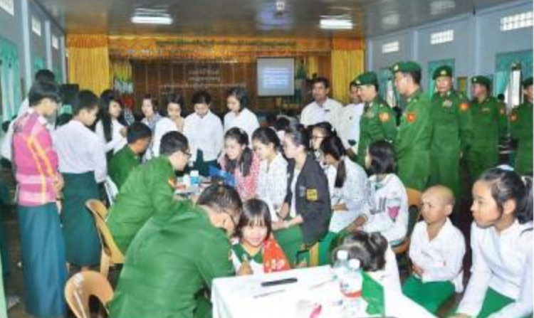
အရှေ့မြောက်တိုင်းစစ်ဌာနချုပ် တိုင်းမှူး ဗိုလ်မှူးချုပ်ခင်လှိုင် နယ်လှည့်ဆေးကုသရေးအဖွဲ့က ကျောင်းသား၊ ကျောင်းသူများအား ကျန်းမာရေးစောင့်ရှောက်မှုလုပ်ငန်းများဆောင်ရွက်ပေးနေမှုကို ကြည့်ရှုအားပေးစဉ်။

နေပြည်တော် ၇ ဇူလိုင် ၁၃ ရှမ်းပြည်နယ်(မြောက်ပိုင်း)၊ လားရှိုးမြို့ရှိ အမှတ်(၇)အခြေခံပညာအထက်တန်းကျောင်းမှ ကျောင်းသား၊ ကျောင်းသူများအား ယနေ့ နံနက်ပိုင်းတွင် အရှေ့မြောက်တိုင်းစစ်ဌာနချုပ် နယ်လှည့်ဆေးကုသရေးအဖွဲ့က အဆိုပါ ကျောင်း၌ ကျန်းမာရေးစောင့်ရှောက်မှုလုပ်ငန်းများနှင့် ကျန်းမာရေးအသိပညာပေးဟောပြောမှုများဆောင်ရွက်ပေးသည်။ ဦးစွာ နယ်လှည့်ဆေးကုသရေးအဖွဲ့က ကျောင်းသား၊ ကျောင်းသူများအား ဝမ်းပျက် ဝမ်းလျှောရောဂါ၊ သွေးလွန်တုပ်ကွေးရောဂါနှင့် မူးယစ်ဆေးဝါးအန္တရာယ်တားဆီးရေးဆိုင်ရာ သိကောင်းစရာများကို ကျန်းမာရေးအသိပညာပေး ဟောပြောဆွေးနွေးသည်။ (၁၀၀)