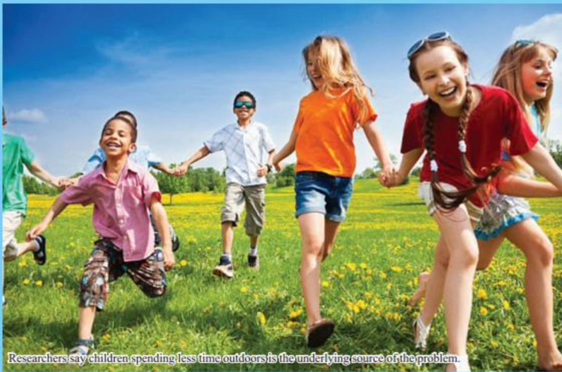
Researchers say children spending less time outdoors is the underlying source of the problem.

Children who spend less time outdoors and do not play much sport are more likely to be near-sighted, new research suggests.