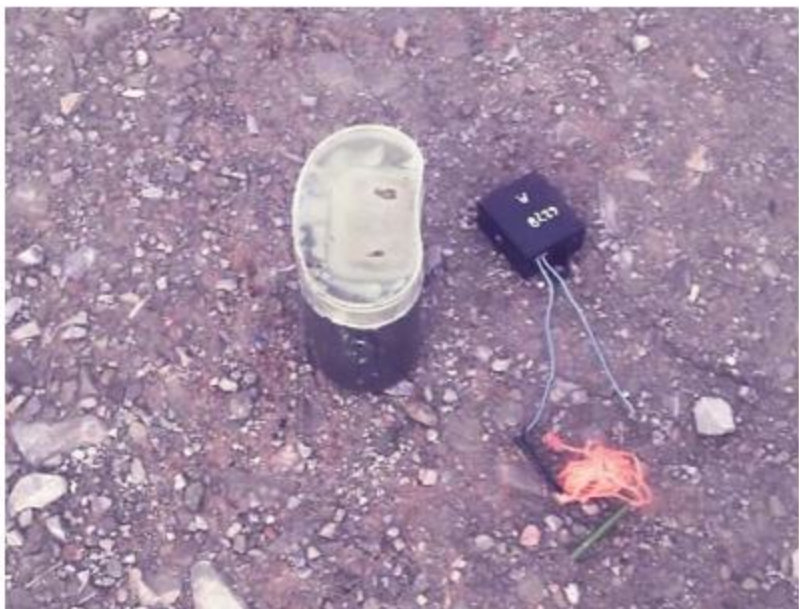
အကြမ်းဖက်သောင်းကျန်းသူများထောင်ထားသည့် ဒေသန္တရလုပ် အဝေးထိန်းစနစ်မိုင်းကို တွေ့ရစဉ်။

နေပြည်တော် ၇ ဇူလိုင် ၁၃ ရှမ်းပြည်နယ်(မြောက်ပိုင်း) ကြို့ကုတ် (ပန်ဆိုင်)မြို့နယ်အတွင်းရှိ မော်တောင်း ကျေးရွာ၏အနောက်ဘက် မီတာ ၂၅၀၀ ခန့် အကွာ မော်တောင်း-၁၀၅ မိုင်သွားကားလမ်း အနီး၌ အကြမ်းဖက်သောင်းကျန်းသူများထောင် ထားသည့် ဒေသန္တရလုပ်လုပ်မိုင်းတစ်လုံး တွေ့ရှိရကြောင်း ယနေ့ညနေ ၃ နာရီခန့်တွင် ဒေသခံတိုင်းရင်းသားပြည်သူတစ်ဦး၏ သတင်း ပို့ချက်အရ နယ်မြေခံတပ်မှ တပ်မတော်သား များက သွားရောက်ရှင်းလင်းရာ အဆိုပါနေရာ တွင် ဒေသန္တရလုပ်အဝေးထိန်းစနစ်မိုင်းတစ် လုံးအား တွေ့ရှိရသဖြင့် နယ်မြေခံတပ်မှ အထူးမိုင်းရှင်းလင်းရေးတပ်ဖွဲ့များဖြင့် သက်မဲ့ ပြုလုပ်ရှင်းလင်းခဲ့ပြီး အဆိုပါနေရာတစ်ဝိုက် အား နယ်မြေရှင်းလင်းရေးလုပ်ငန်းများ ဆောင်ရွက်လျက်ရှိကြောင်း သတင်းရရှိ သည်။ (၁၀၀)